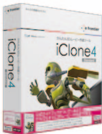
iClone4 Standard ガイドブック付

株式会社イーフロンティア(本社:東京都新宿区、代表取締役: 安藤 健一)は、だれもが簡単に3Dムービーを作成できる Reallusion 社のソフトウェア、『iClone4』に公式ガイドブックをバンドルした『iClone4 Standard ガイドブック付』と『iClone4 PRO ガイドブック付』、学生・教職員の方向けのアカデミック版『iClone4 Standard アカデミック』と『iClone4 PRO アカデミック』を2010年12月17日(金)に発売いたします。