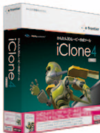
iClone4 PRO ガイドブック付