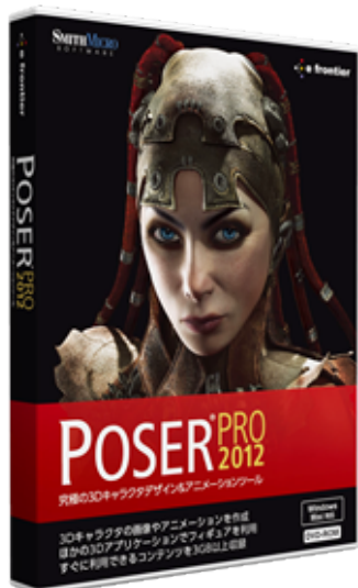
[ポージャー プロ ニセンジュウニ]

プロのアーティストのための3D キャラクターデザインとアニメーション作成ツールとして多くのクリエイターに支持されている「Poser Pro 2012」に、ユーザー待望の日本語版が登場します。