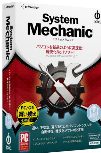
iolo System Mechanic BOXイメージ

現在のPCは、ソフトウェアや環境により多様な構成となり常に進化を続けています。イーフロンティアはシステムメンテナンスに関して歴史と豊かな経験を持つiolo technologies社の製品を日本国内に広く紹介し、クリエイター始めPCユーザーのより快適な活動を強く応援して参ります。